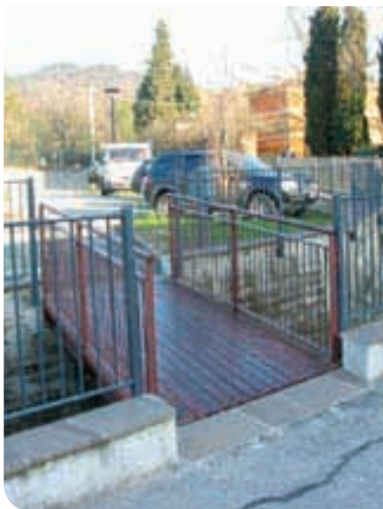
2013 - Passaggio pedonale piazza Roma

FEDERICO ALTIN Assessore alla viabilità ai lavori pubblici