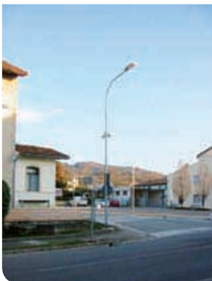
2014 - Impianti di videosorveglianza