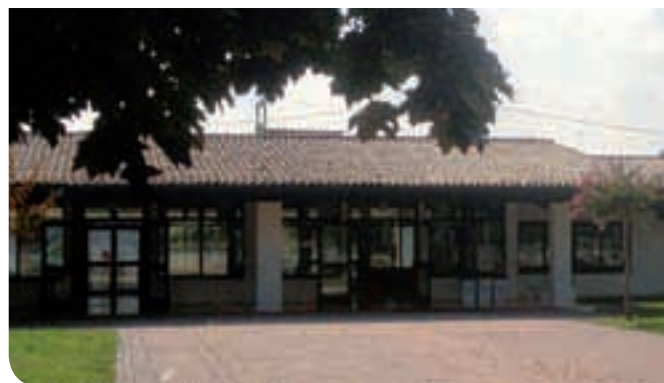
2012 - 2013 - Interventi di rafforzamento strutturale scuola elementare via Callesella