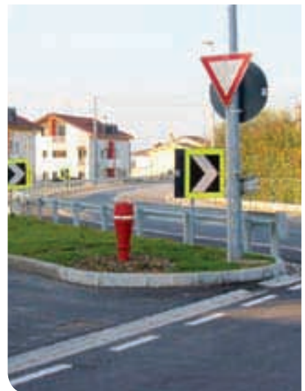
2013 - Messa in sicurezza via Metti - via Bas- sanese a Coste