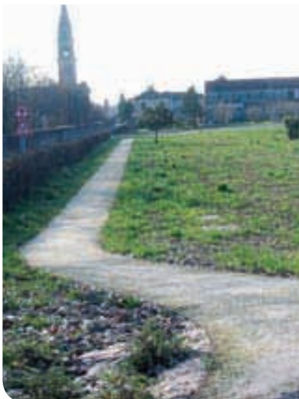
2012 - 2013 Sistemazione area via Wojtyla