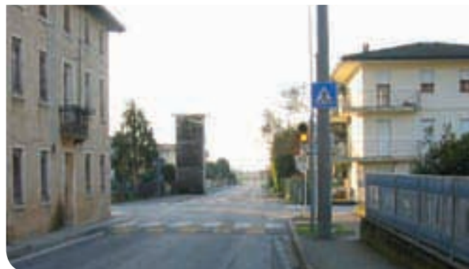
2011 - 2013 Dossi in asfalto - incrocio Caldoro