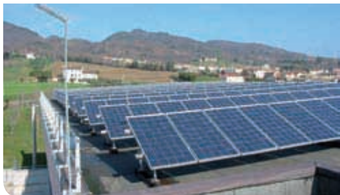
2009 - Impianto fotovoltaico sulla copertura della scuola "P. Veronese"

Una panoramica delle opere del quinquennio 2009/2014