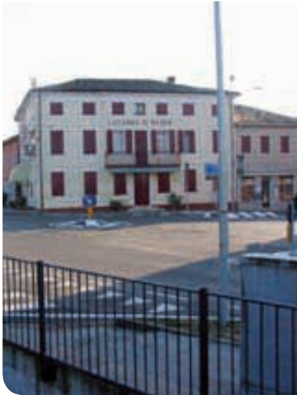
2012 - 2013 Nuova rotondina di piazza Roma