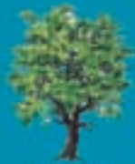
potatura siepi e piante