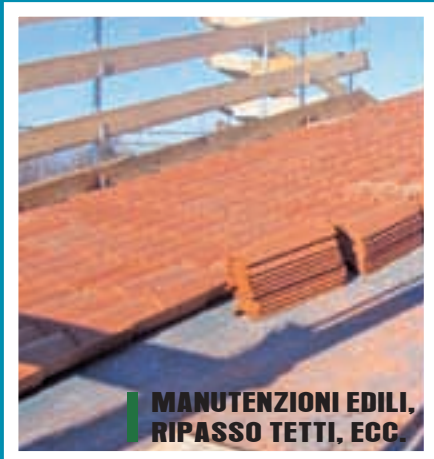
■ MANUTENZIONI EDILI, RIPASSO TETTI, ECC.