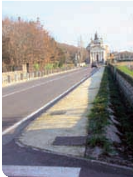
2012 - 2013 Realizzazione vialetti pedonali Villa di Maser