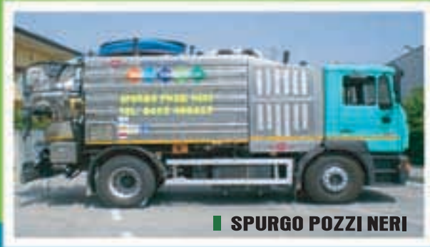
■ SPURGO POZZI NERI