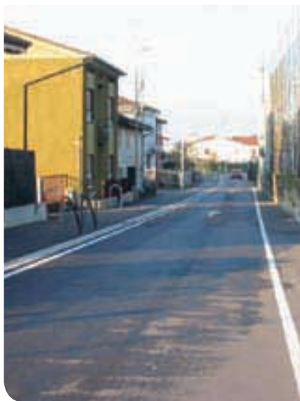
2013 - Pista ciclabile via Metti