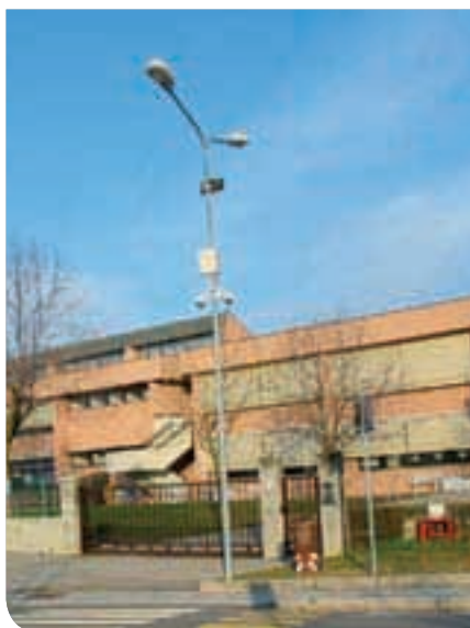
2014 - Impianti di videosorveglianza