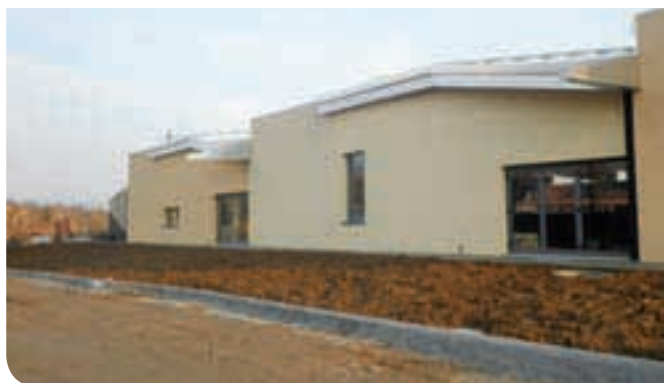
2011 - Completamento PalaMaser e realizzazione area esterna