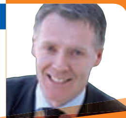
DANIELE DE ZEN Sindaco e Assessore alla cultura, al turismo, alla sicurezza, all'ambiente ed ecologia, all'agricoltura e affari generali