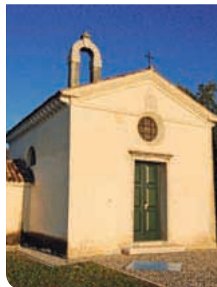
2014 - Restauro chiesetta di San Vettore