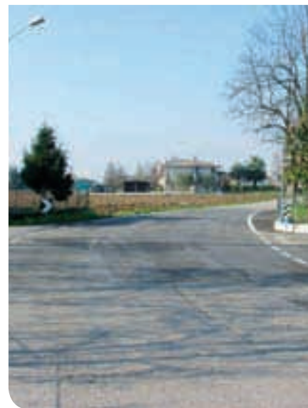
2013 - Rettifica curva via Montello