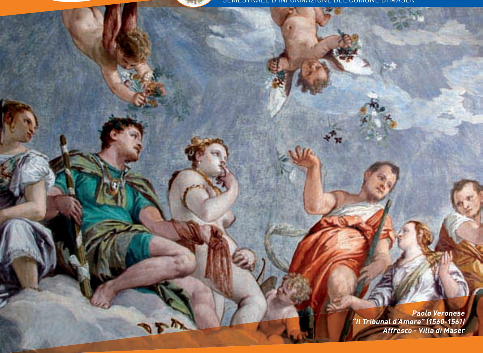
Paolo Veronese "Il Tribunal d'Amore" (1560-1561) Affresco - Villa di Maser

SEMESTRALE D'INFORMAZIONE DEL COMUNE DI MASER