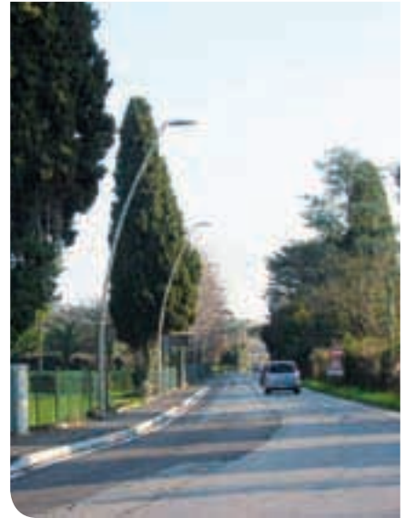
2012 - 2013 Rifacimento impianto pubblica illuminazione a Crespignaga