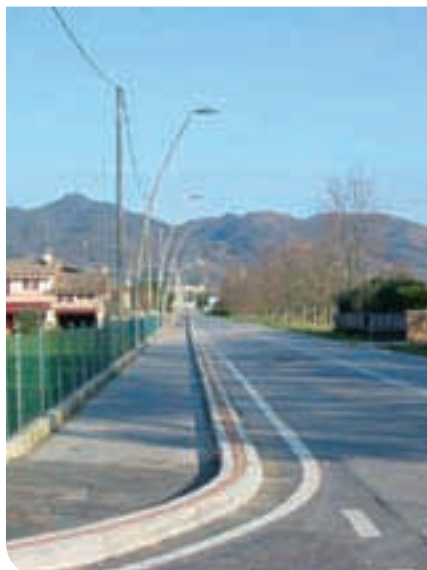
2012 Realizzazione pista ciclabile via Cal- dretta